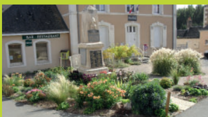
Embellissement du parvis de la Mairie de Dissé-sous-le-Lude.