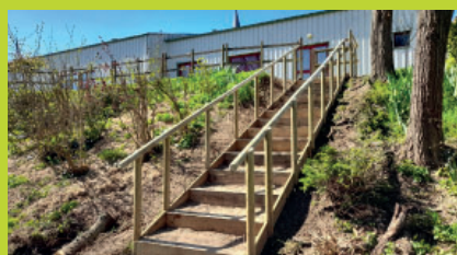
Escalier d'accès au abords de la Marconne à Dissé-sous-Le-Lude.