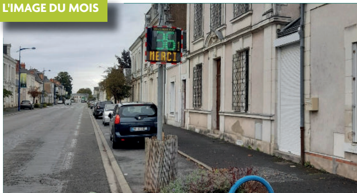
Un radar pédagogique a été installé sur le Boulevard Fisson à proximité des passages scolaires afin de réduire la vitesse des automobilistes.