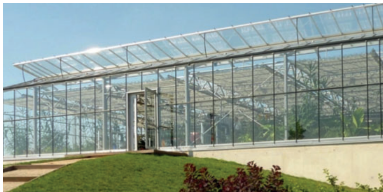
La station de phytoépuration "Organica"