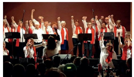
La chorale "Euphonia"