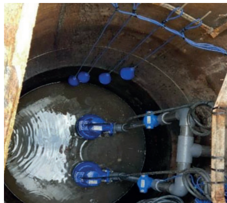
Un poste de relevage.

Avant même la station, chacun peut agir. Les lingettes, huiles de friture, solvants ou médicaments n'ont rien à faire dans les canalisations. Ils compliquent le traitement, perturbent les installations et augmentent les coûts. Un geste citoyen consiste à utiliser les poubelles, déchèteries et pharmacies pour les éliminer correctement. Pour information sur l'année 2024 c'est près de 6 tonnes de déchets de dégrillage.