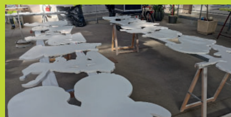
Les décorations de Noël sont fabriquées directement dans les ateliers des services techniques.